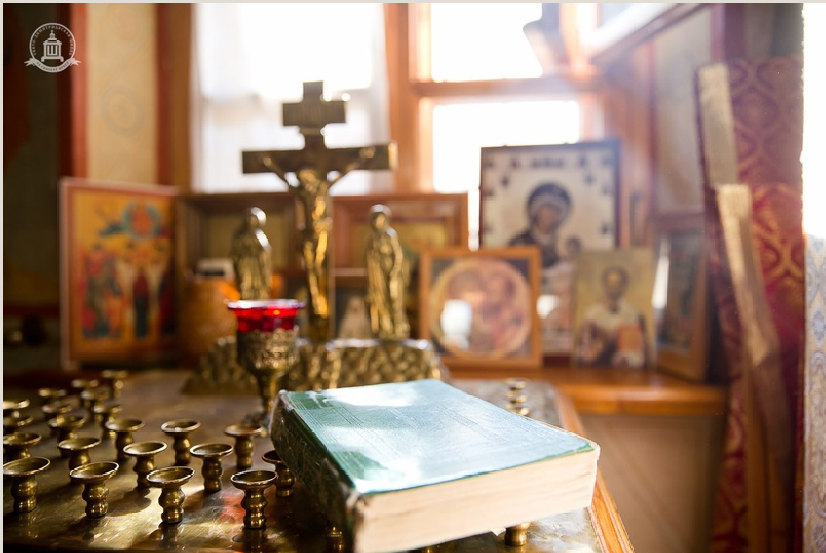
XXXII Международные Рождественские образовательные чтения