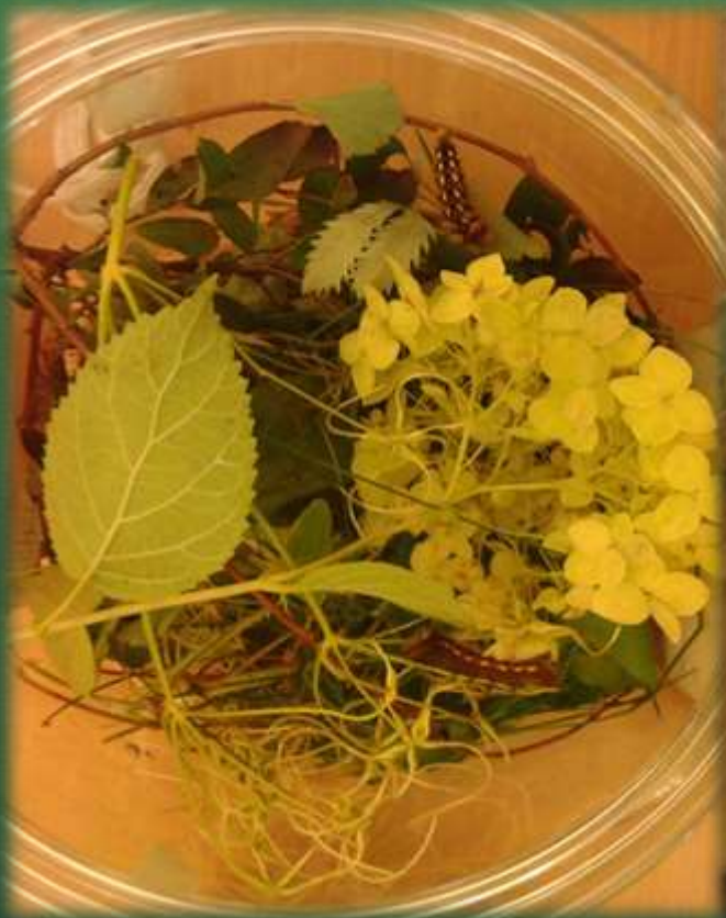
Еда мохнатых гусениц (листья барбариса)