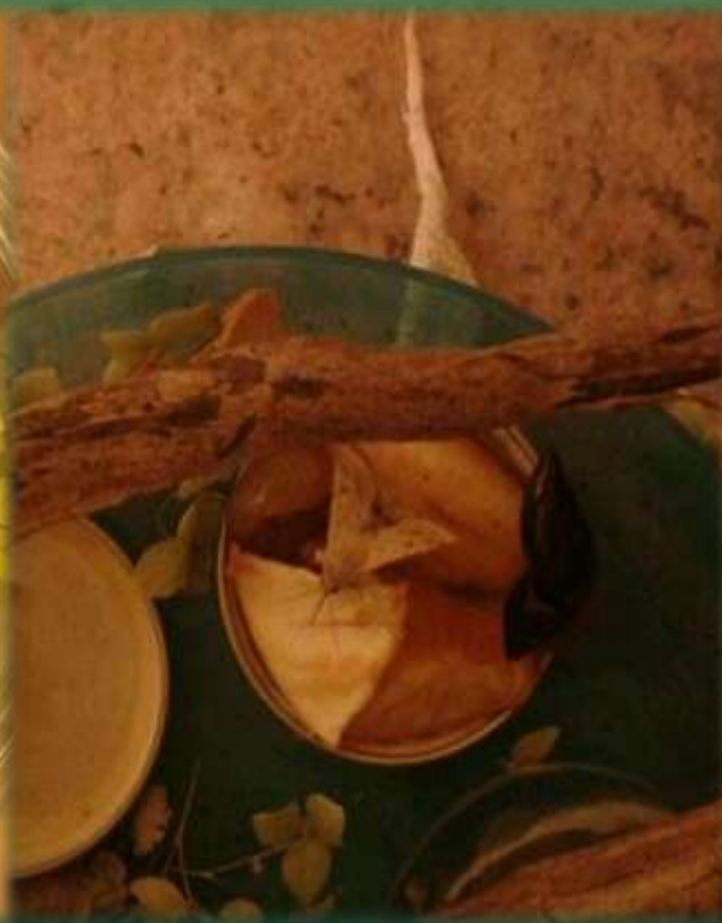
Питание Совки (груша)