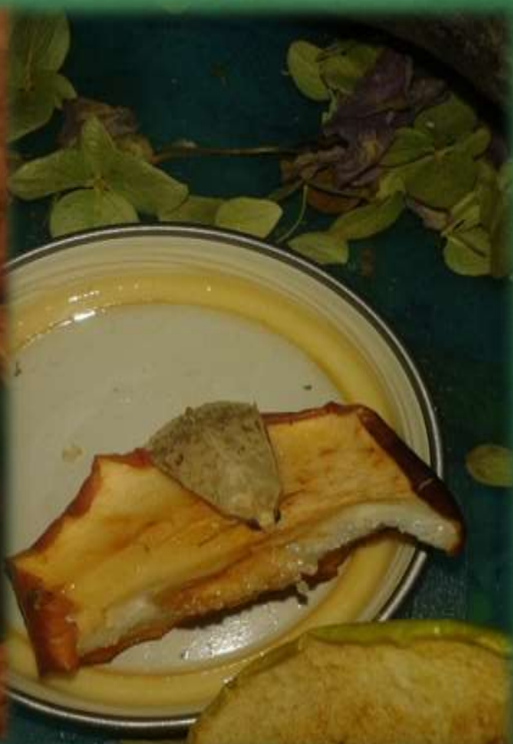
Питание Совки (яблоко)